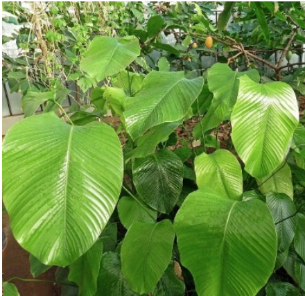
Abbildung 1: Katemfe ( Thaumatococcus daniellii , Foto: James Steakley, cc 3.0)

Thaumatin ist ein süß schmeckendes Proteingemisch, das natürlicherweise in der Frucht der westafrikanischen Pflanze Katemfe ( Thaumatococcus daniellii , Abbildungen 1 und 2) vorkommt. Es wurde erstmals vor über 50 Jahren als Proteinmischung – mit Thaumatin I und II als hervorstechende Süßkomponenten – isoliert. (van der Wel und Loeve 1972) Die sechs in Thaumatin nachgewiesenen Proteine unterscheiden sich durch die Sequenz aller 207 Aminosäuren. Bis auf Histidin sind alle Aminosäuren vertreten. Die räumlichen Strukturen der einzelnen Proteine weichen nur geringfügig voneinander ab. (Abbildung 3, Breiteneder 2004)