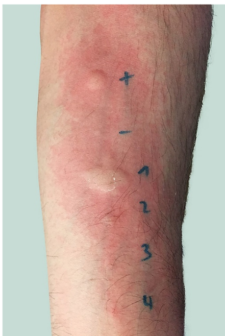
Abbildung 4: Hautpricktests am Unterarm eines Probanden aus einer Kaugummiabrik. + Histamin; - NaCl; 1 : reines Thaumatococcus; 2 : reines Gummi arabicum; 3 : Guarkernmehl; 4 : Johannisbrotkernmehl (Tschannen et al. 2027)

säuresequenz. Ihr Molekulargewicht reicht von 10 bis 34 kDa. Sie sind hitze- und säurestabil und leicht löslich. Sie gehören zur Gruppe der pathogenesebezogenen Proteine, PR5. Die mit der Pathogenese zusammenhängenden Proteine stellen keine Superfamilie von Proteinen dar, sondern sind eine Ansammlung von nicht miteinander verwandten Proteinfamilien, die als Teil des pflanzlichen Abwehrsystems fungieren. TLPs werden in der Regel als Reaktion auf biotischen Stress, wie zum Beispiel Viren-, Bakterien- oder Pilzbefall, produziert. (Breiteneder 2004)