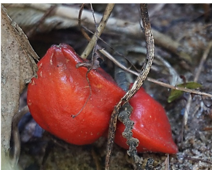
Abbildung 2: Früchte von Thaumatococcus daniellii

Thaumatin ist ein süß schmeckendes Proteingemisch, das natürlicherweise in der Frucht der westafrikanischen Pflanze Katemfe ( Thaumatococcus daniellii , Abbildungen 1 und 2) vorkommt. Es wurde erstmals vor über 50 Jahren als Proteinmischung – mit Thaumatin I und II als hervorstechende Süßkomponenten – isoliert. (van der Wel und Loeve 1972) Die sechs in Thaumatin nachgewiesenen Proteine unterscheiden sich durch die Sequenz aller 207 Aminosäuren. Bis auf Histidin sind alle Aminosäuren vertreten. Die räumlichen Strukturen der einzelnen Proteine weichen nur geringfügig voneinander ab. (Abbildung 3, Breiteneder 2004)