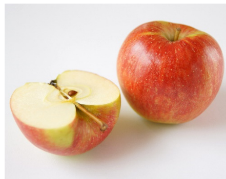
Abbildung 5: Äpfel können auch Allergene wie Mal d 2 enthalten.

Das Allergen Mal d 2 (Apfel) ist das erste beschriebene Lebensmittelallergen, das zur TLP-Gruppe gehört. Dieses Protein mit einem Molekulargewicht von 23 kDa kommt in den Früchten des heimischen Apfelbaums vor; es ist sowohl im Fruchtfleisch als auch in der Schale der Früchte enthalten. (Abbildung 5)